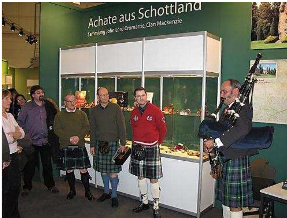
Piping for the Chief